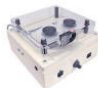
Schirmbürster BSB 1005 A/B

Elektrische Maschine zum Entflechten von Kabelschirmen von Durchmesser ca. 2 - 30 mm. BSB 1005 mit Rundbürsten bzw. BSB 1011 mit Bändern..