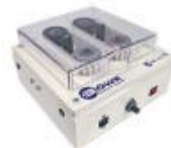
Schirmbürster BSB 1011